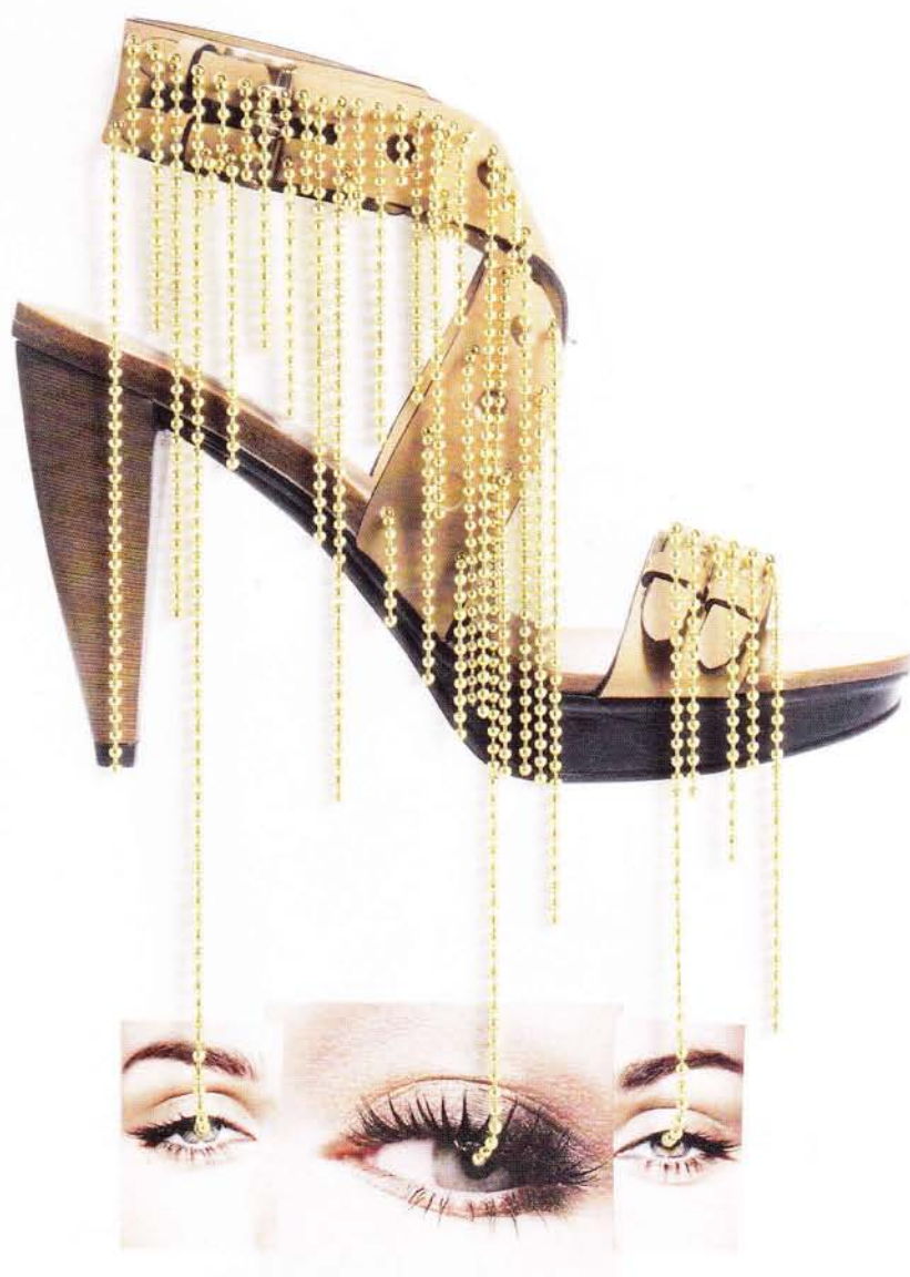
Tod's Sandale New Sasha en cuir naturel, talon en bois