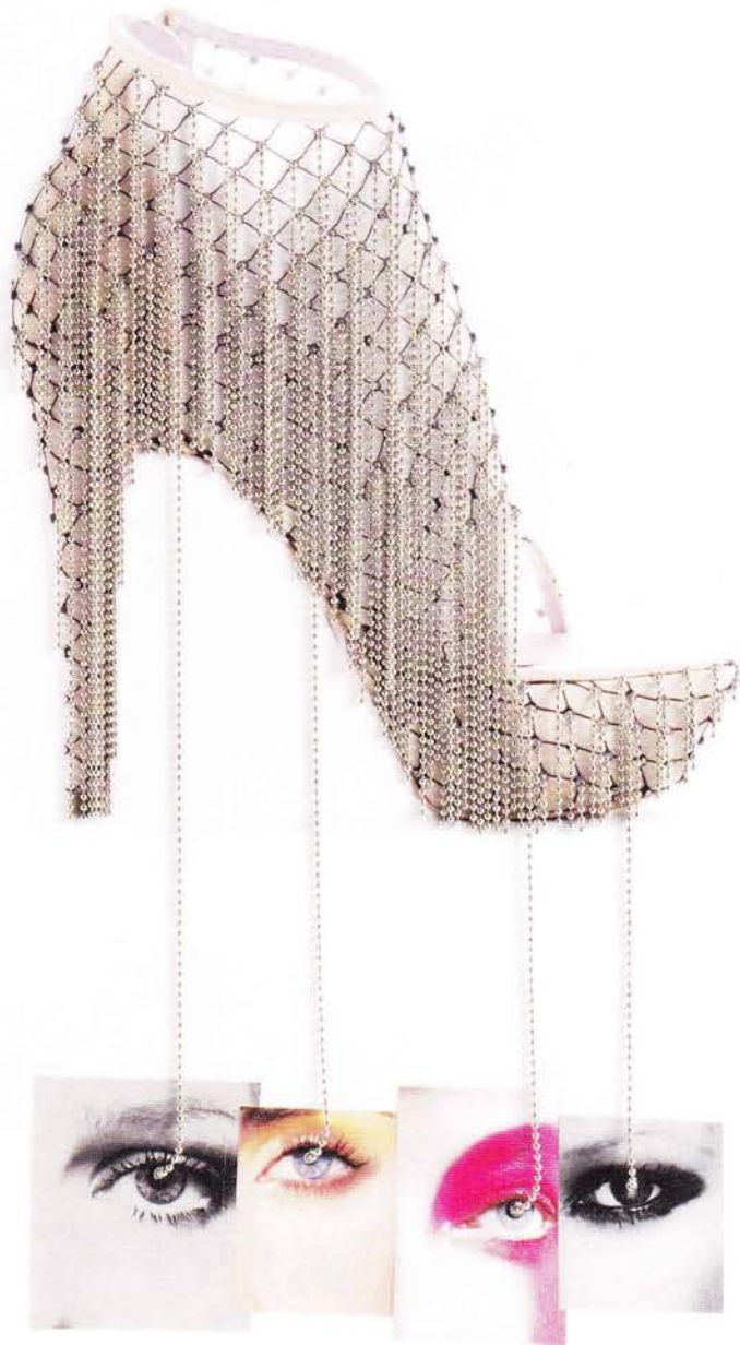
Viktor & Rolf Bottine en cuir et résille rebrodée de cristaux Swarovski