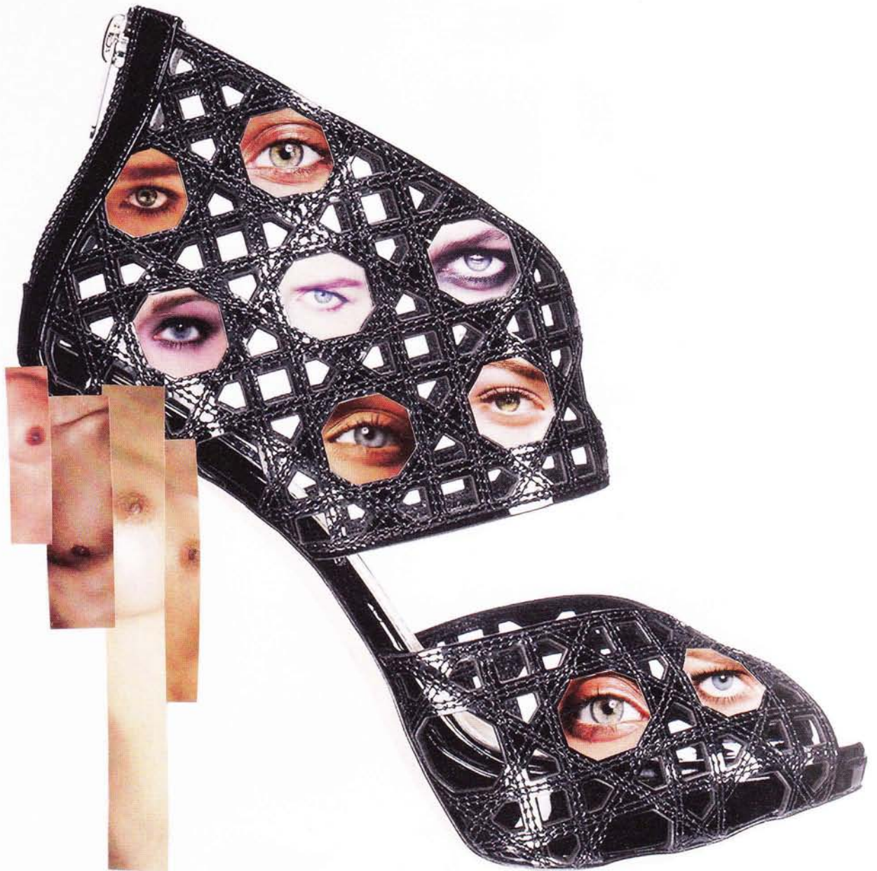
Dior Sandale en cuir verni